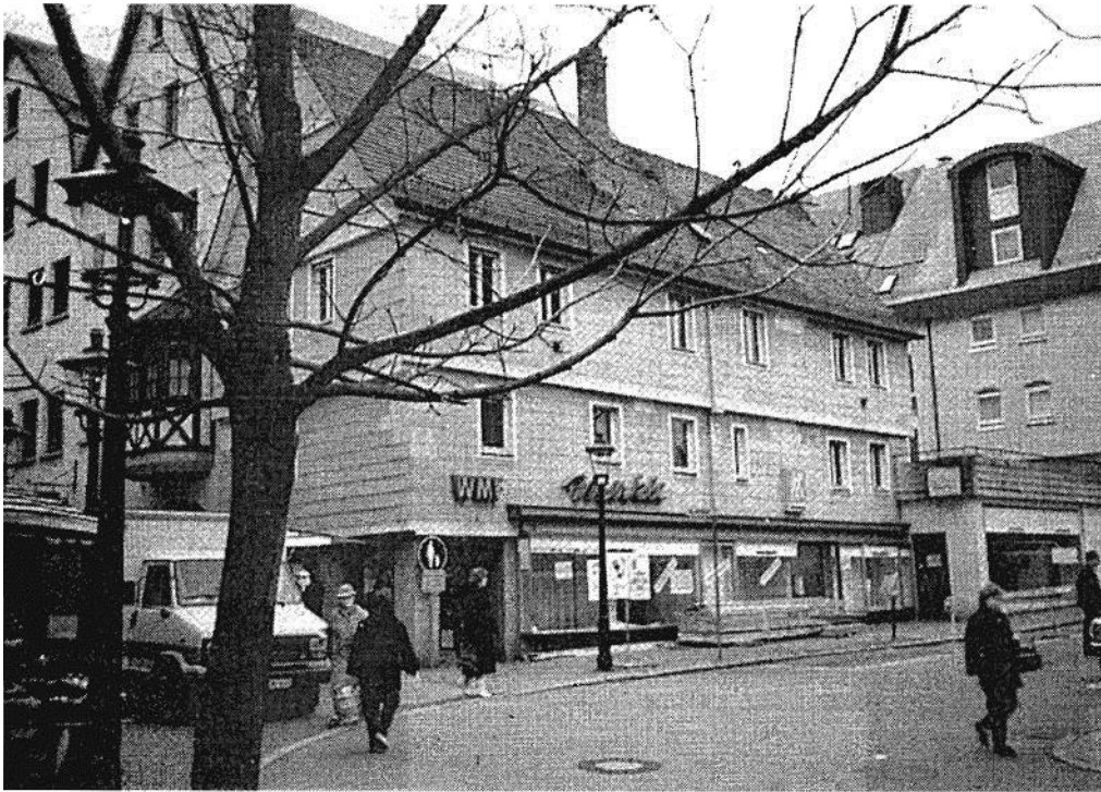
Das Haus Schillerstraße 11 im alten Zustand.